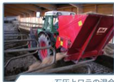
石灰とワラの混合